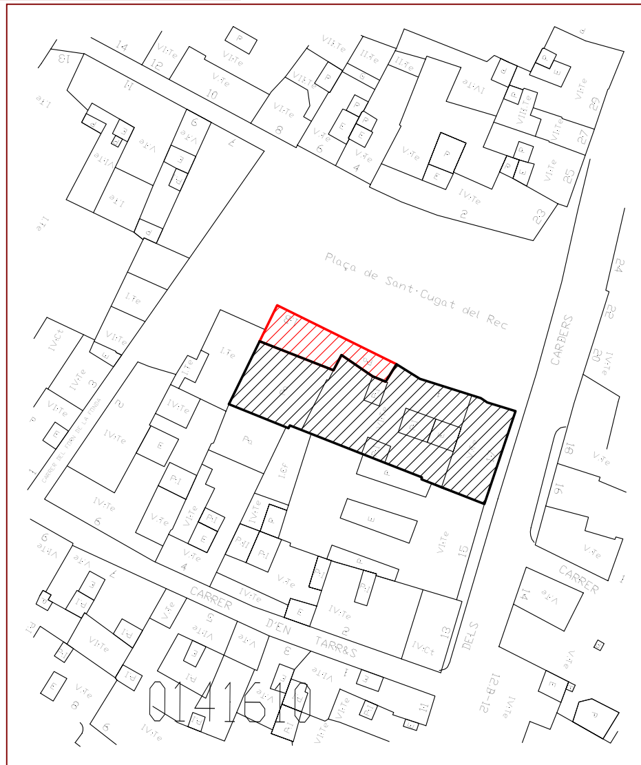
Plànol parcel·lari de la zona amb indicació de l'espai ocupat per l'edifici de Carders núm. 17 i del peti pati on s'ha realitzat l'excavació (indicat amb vermell)