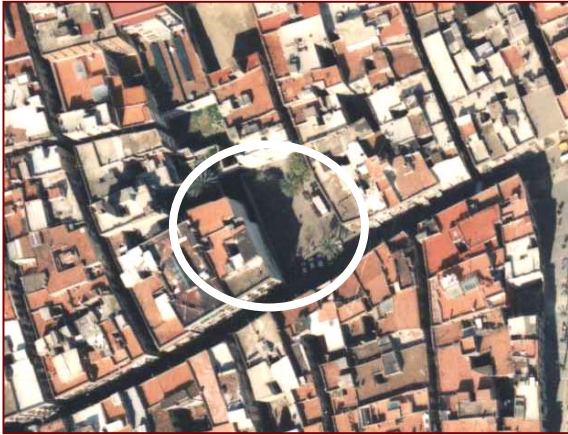
Vista aèria de la zona amb indicació de l'àmbit ocupat per la plaça de Sant Cugat del Rec i l'edifici núm. 17 del carrer Carders