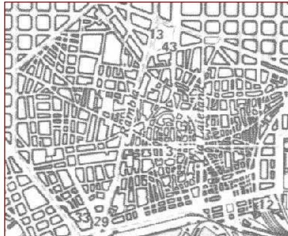
Localització aproximada de la zona en la que s'ubica l'edifici objecte d'aquest estudi sobre el pla de la ciutat (a l'esquerra) i sobre la ciutat vella de Barcelona (a la dreta).

L'àrea de l'excavació s'ha centrat en una petita zona situada en un dels reclus que formalitza la paret mitgera més septentrional de la finca i que es defineix avui dia com un petit pati descoberts. Val a dir que aquesta peculiar configuració parcel·lària i també urbanística és conseqüència d'una curiosa i alhora complexa evolució històrica. No debades es tracta d'un indret amb veïnatge a l'avui desapareguda església de Sant Cugat del Rec de la qual en formà part pràcticament des dels seus orígens (pels volts del segle XI) fins a la